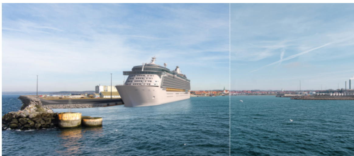
Figur 3 Projektet giver Rønne Havn mulighed for at modtage krydstogtskibe i inderbassinet som vist på visualiseringen. Der er flere visualiseringer i miljøkonsekvensrapporten, herunder også visualisering af de kumulative effekter fra de fire etaper samlet.

Da miljøvurderingen gennemføres som en samlet proces påser administrationen, at et udkast til tilladelse efter miljøvurderingsloven fremlægges i samme høring som planforslagene og den samlede miljøkonsekvensrapport.