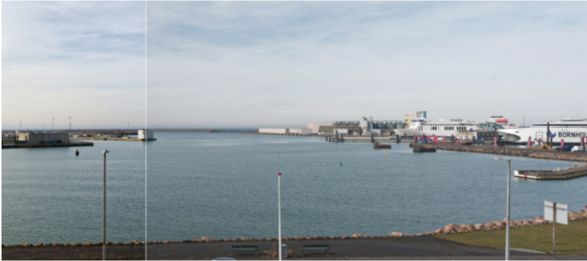
Figur 2 Visualisering set fra Kapelvej af byggemuligheder i lokalplan 158.

Forslag til lokalplan nr. 158 for ny multifunktionskaj på Rønne Havn kan ses som bilag 2