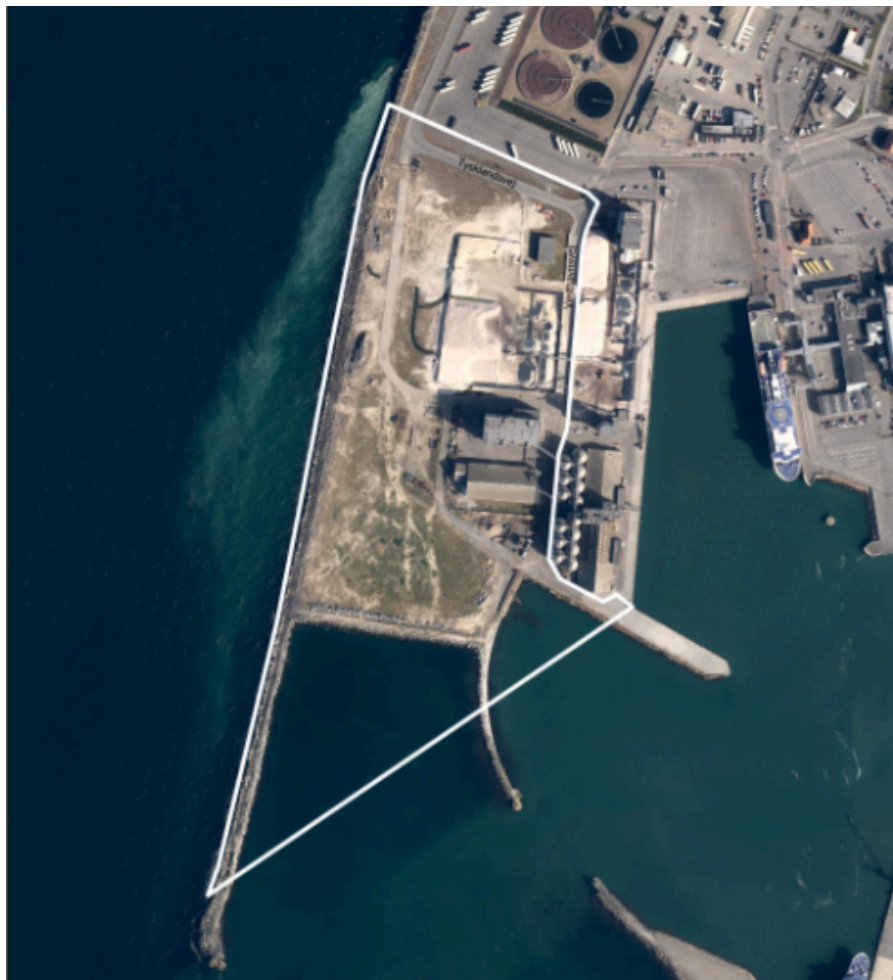
Figur 1 Afgrænsning af lokalplanområdet. Afgrænsningen er vist på luftfoto. Lokalplanen giver mulighed for at vandareal indenfor afgrænsningen må opfyldes.

Forslag til kommuneplantillæg nr. 27 for ny multifunktionskaj på Rønne Havn kan ses som bilag 1