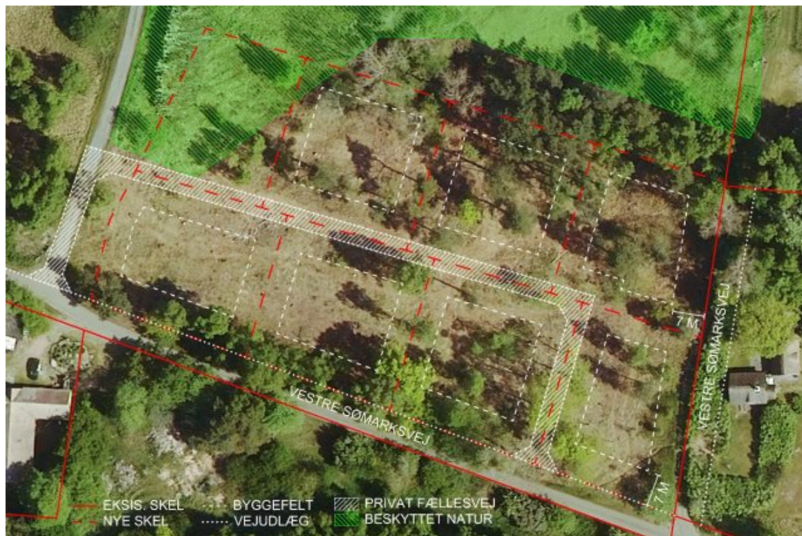
Ill. 1: Principiel udstykningsplan

Bygherre ønsker området udstykket til syv sommerhusgrunde samt et fælles friareal. Sommerhusgrundene vil få en størrelse på tilnærmelsesvis 1100 m 2 inkl. deres andel af det fælles friareal og ekskl. vejudlæg. Bygherre foreslår at områdets karaktergivende bevoksning fastholdes, og at det fælles friareal placeres i det nordvestlige hjørne, som er omfattet af naturbeskyttelse. Administrationen foreslår at sikre vejadgangen med et vejudlæg i en bredde på 4 meter. Den endelige udstykningsplan vil blive fastlagt i forbindelse med udarbejdelsen af lokalplanforslaget.