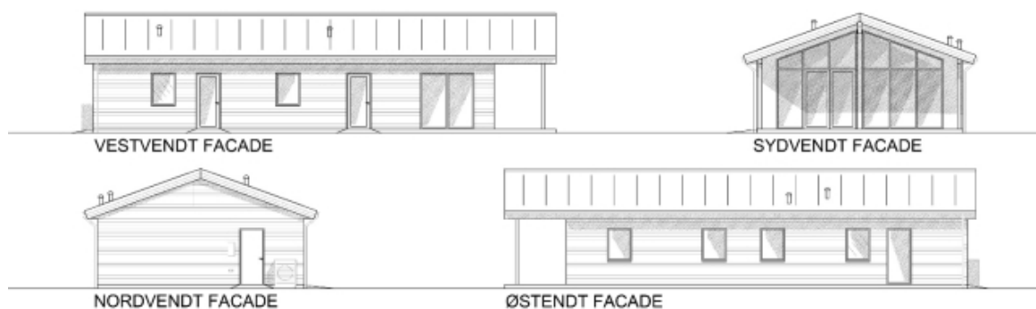
Ill. 2: Principielle Facadeopstalter

Bygherre ønsker mulighed for på den enkelte ejendom at opføre 110 m 2 boligbebyggelse og 25 m 2 sekundær bebyggelse, som sammenbygges. Dette vil svare til en bebyggelsesprocent på ca. 10 ekskl. vejudlæg. Administrationen foreslår at bebyggelse holdes i en minimumsafstand på 7 meter til naboejendommen og vejudlægget tilhørende Vestre Sømarksvej. Bygherre ønsker at beklæde facader med vandret bræddebeklædning og tagflader med mørkt tagpap.