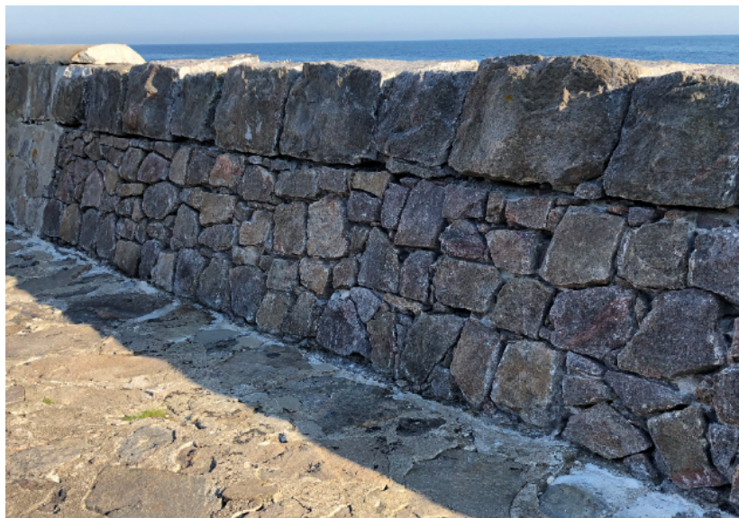
Billede 2: Strækning hvor den inderste del af bølgeskærm er blotlagt, herunder er den runde kappe på toppen fjernet. Dette arbejde er udført under bevillingen, men mangler afsluttende fugning.

De to strækninger hvor der er udført arbejde under bevillingen vil i det videre arbejde med klimasikringsprojektet fungere som en form for prøvefelter med eksempler på hvordan sikringsarbejdet kan gribes an.