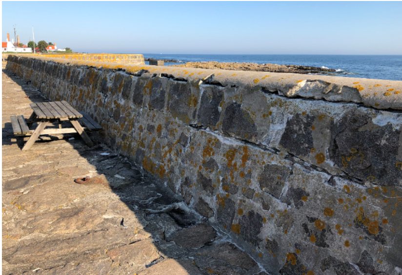
Billede 1: Strækning med behov for sikring via regulært fugearbejde.

Efterfølgende har man i Center for Natur, Miljø og Fritid indhentet nye faglige vurderinger af havneværkernes tilstand og det planlagte sikringsarbejde. Anbefalingerne peger på et behov for akut sikring af kajstrækninger og mure på hele havnens areal i form af regulært fugearbejde med udbedring af forvitrede fuger og revner i både kajanlæg og bølgeskærm. Dette arbejde vil sikre mod yderligere nedbrud i form af frostsprængninger og skader ved stærk pålandsvind. Ydermere mindskes indtrykket af manglende vedligehold og forfald som præger denne del af havnen i dag. Anbefalingerne ligger i tråd med ønsker fra brugerrådet.