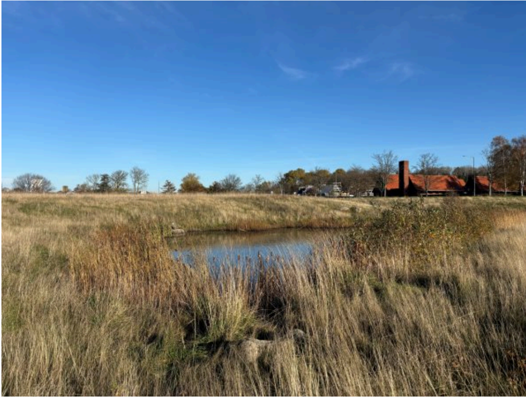
regnvandsbassinet set fra syd. Søen i regnvandsbassinet er §3 beskyttet.