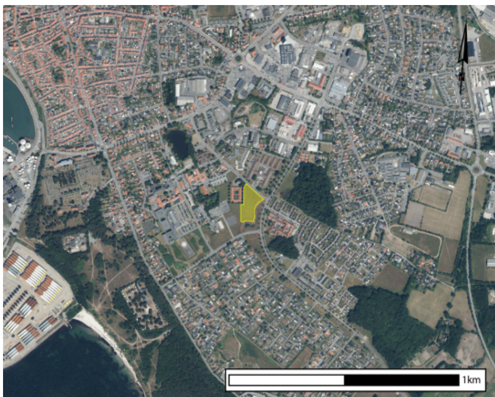
Projektområdet i Rønne Syd, med 700 meter til stranden.

Med projektet arbejdes der for visionen om at nå 42.000 bornholmere i 2028 gennem udvikling af nye, attraktive boliger.