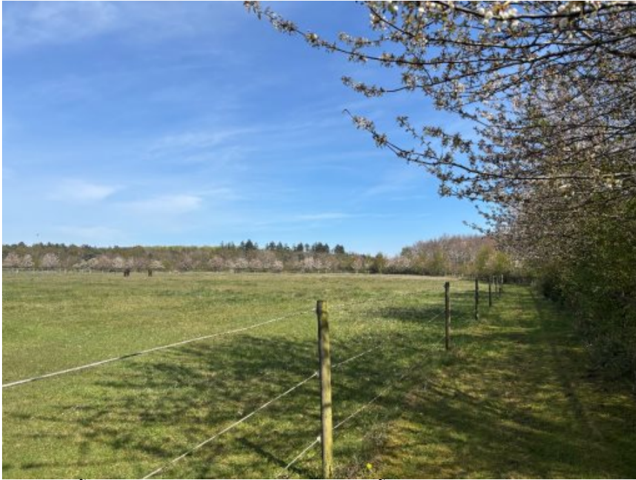
Planområdet med udsigt til skoven. Planområdet er omkranset af en veletableret randbeplantning