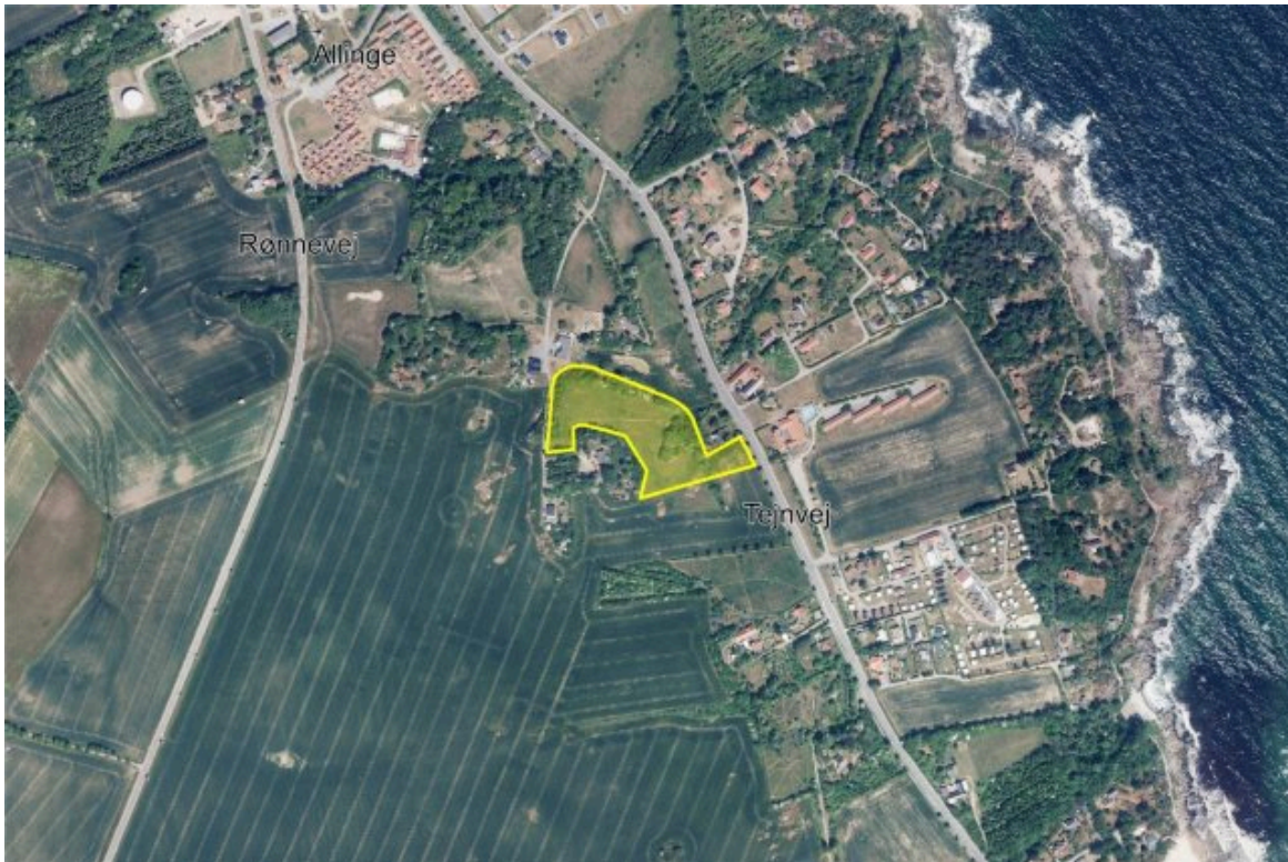
Oversigtskort med indtegnede planområde

Under den offentlige høring indkom der to høringssvar, som fremgår i deres fulde længde af bilag 3 og i resumeret form af bilag 4. Af bilag 4 fremgår også grundejers og administrationens bemærkninger til de enkelte høringssvar, som herunder gengives i kort form.