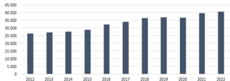
Figur 2 – Årligt antal Last- og sættevogne på ruten Køge-Rønne (2012-2022)

Den mindre nedgang – og den aktuelt forbedrede situation – skal dog ses i lyset af, at der i 2022 blev transporteret historisk mange godskøretøjer til/fra øen. De seneste 10 år er antallet last- og sættevogne, der transporteres via Køgeruten, steget med godt 50 pct., jf. figur 2.