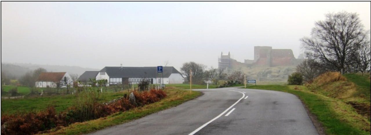
Det nuværende besøgscenter i Slotsgården ønskes nedrevet, således at sletten foran Hammershus fritlægges.

På baggrund af en donation fra A.P. Møller og Hustru Chastine Mc-Kinney Møllers Fond til Almene Formaal har Naturstyrelsen fået midler til at forbedre disse forhold. Dette var grundlaget for Teknik- og Miljøudvalgets beslutning den 9. april 2013 om at igangsætte den nødvendige planlægning. Inden da havde Bornholms Regionskommune gennemført en forudgående indkaldelse af ideer og forslag. Der indkom ét høringsvar (fra Foreningen Bornholm), som var positivt stemt for ideen om et nyt besøgscenter med den skitserede placering som afløsning for den nuværende bebyggelse.