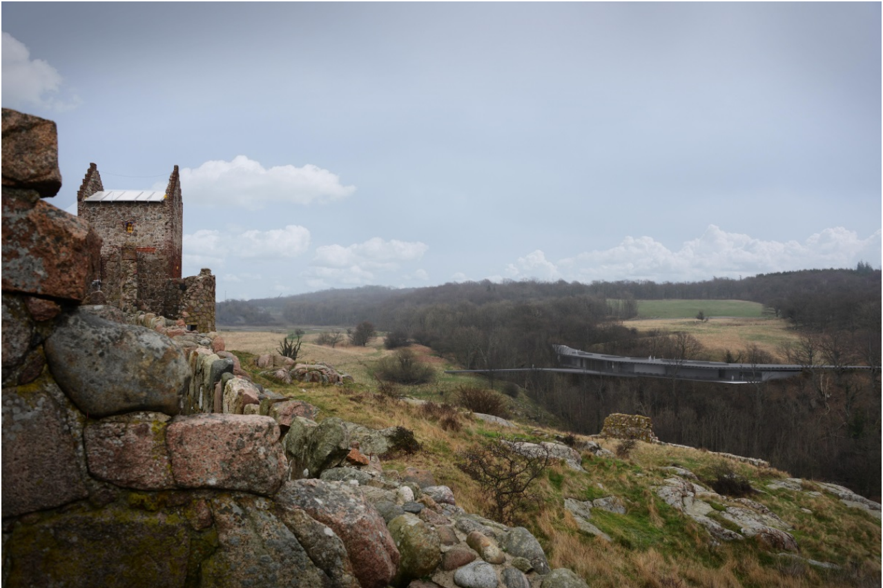
Visualisering af det ny besøgscenter set fra Hammershus. Besøgscentret er placeret på kanten af Mølle dalen. Taget udformes som en udsigtsterrasse. En bro med tilknyttet terrasse forbinder de to sider af Mølle dalen.

Teknik & Miljø har foretaget en scoping af planforslagernes indvirkning på miljøet, og som led heri indhentet bemærkninger fra de berørte myndigheder Naturstyrelsen og Kulturstyrelsen. Der er herefter udarbejdet en miljørapport som er et bilag til lokalplanen. Hovedkonklusionerne i rapporten er følgende: