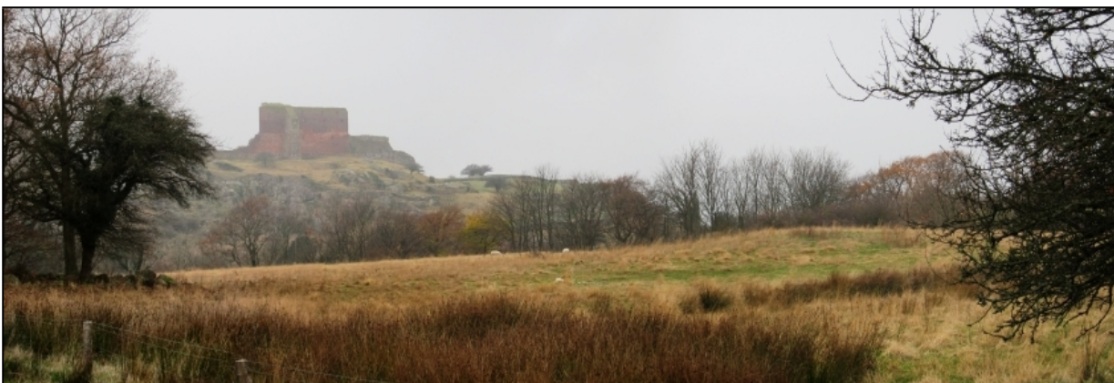
Det ny besøgscenter ønskes placeret på en skråning i den træbevoksede sprækkedal, der løber på tværs midt i billedet. De store højdeforskelle i terrænet giver mulighed for at skjule bebyggelsen, så den ikke vil kunne ses fra Slotslyngsvej, hvor dette foto er optaget.

Teknik & Miljø har på baggrund af projektets nuværende stade udarbejdet et foreløbigt forslag til lokalplan 071 samt et forslag til et kommuneplantillæg nr. 012. I samarbejde med et konsulentfirma, der er stillet til rådighed af bygherren, er der endvidere udarbejdet et udkast til en miljørapport. Når den endelige udformning af broen og terrassen over Mølle dalen er afklaret, vil Teknik & Miljø indarbejde disse i forslaget til lokalplan og i miljørapporten, således at planerne er ajourført til den forventede behandling i kommunalbestyrelsen den 27. marts. Planforslagene og miljørapporten vil efter politisk godkendelse i kommunalbestyrelsen kunne sendes i offentlig høring i 8 uger, hvorefter der kan træffes beslutning om endelig vedtagelse.