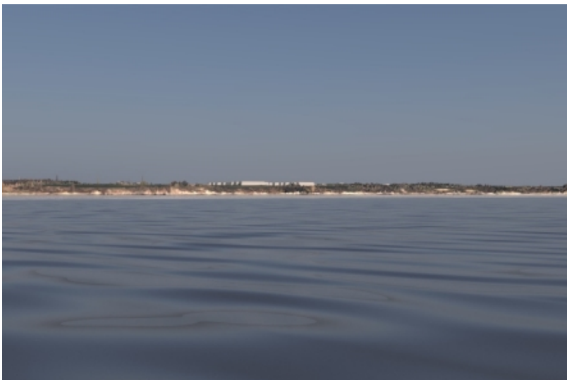
Visualisering set fra havet syd for anlægget.

Kystnærhedszone og visuel påvirkning af kystlandskabet: På grund af anlæggets store omfang og volumen vil højspændingsstationen uundgåeligt blive synligt i landskabet og påvirke landskabsoplevelsen især set fra nordlige retninger og udsigtspunkter, hvor den visuelle sammenhæng med vandfladen vil blive påvirket i større omfang. Set på langs ad kysten vil anlægget være mere skjult og indpasset bag eksisterende terræn og beplantninger, der mindsker anlæggets synlighed fra flere retninger. Den visuelle påvirkning er beskrevet i miljørapporten, bilag 3.