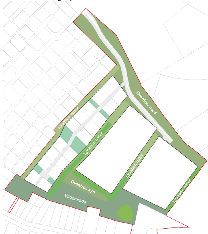
Den grønne struktur i delområde B

Der er eksisterende grøfter og eksisterende levende hegn, som bibeholdes som karakteristiske landskabselementer, som kan bearbejdes på en sådan måde, at de skaber optimale vilkår for biodiversitet og dyreliv. Delområdet omfatter de arealer, hvor der er observeret markfirben.