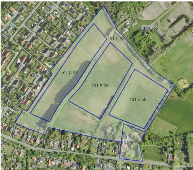
Afgrænsninger af de nye rammeområder

I kommuneplantillægget defineres en grøn struktur og fire rammeområder for byggeri. Kommuneplantillægget fastlægger også vejbetjeningen. De tre delområder vejbetjenes via en forlængelse af Sagavej.