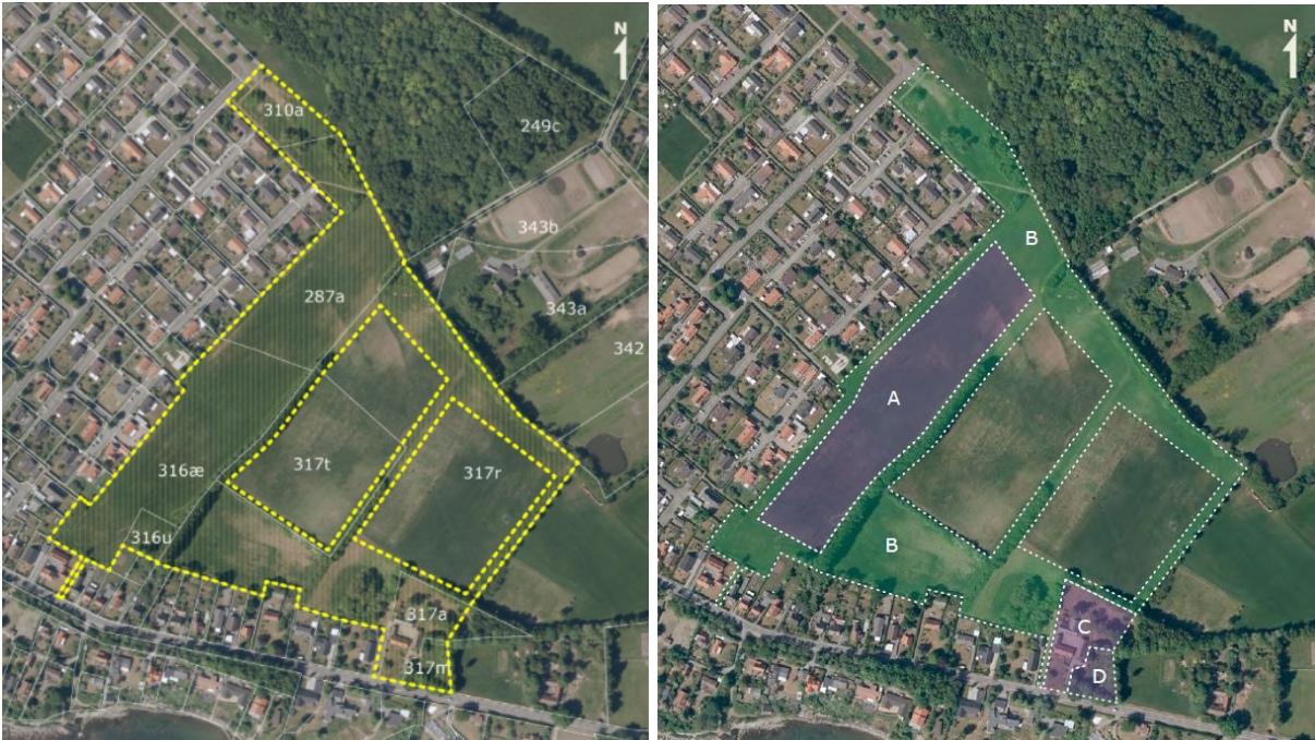
På kortet til venstre ses lokalplanens område, på kortet til højre ses de fire delområder.

Arealet inddeles i fire delområder. Delområde A skal rumme en ny boligbebyggelse samlet omkring en central boligvej. Delområde B skal være ubebygget og skaber en struktur for natur- og friarealer samt rummer veje og stier. Delområde C er en eksisterende ejendom, som i dag rummer et hestehold. Delområde D bliver en byggegrund for en helårsbolig.