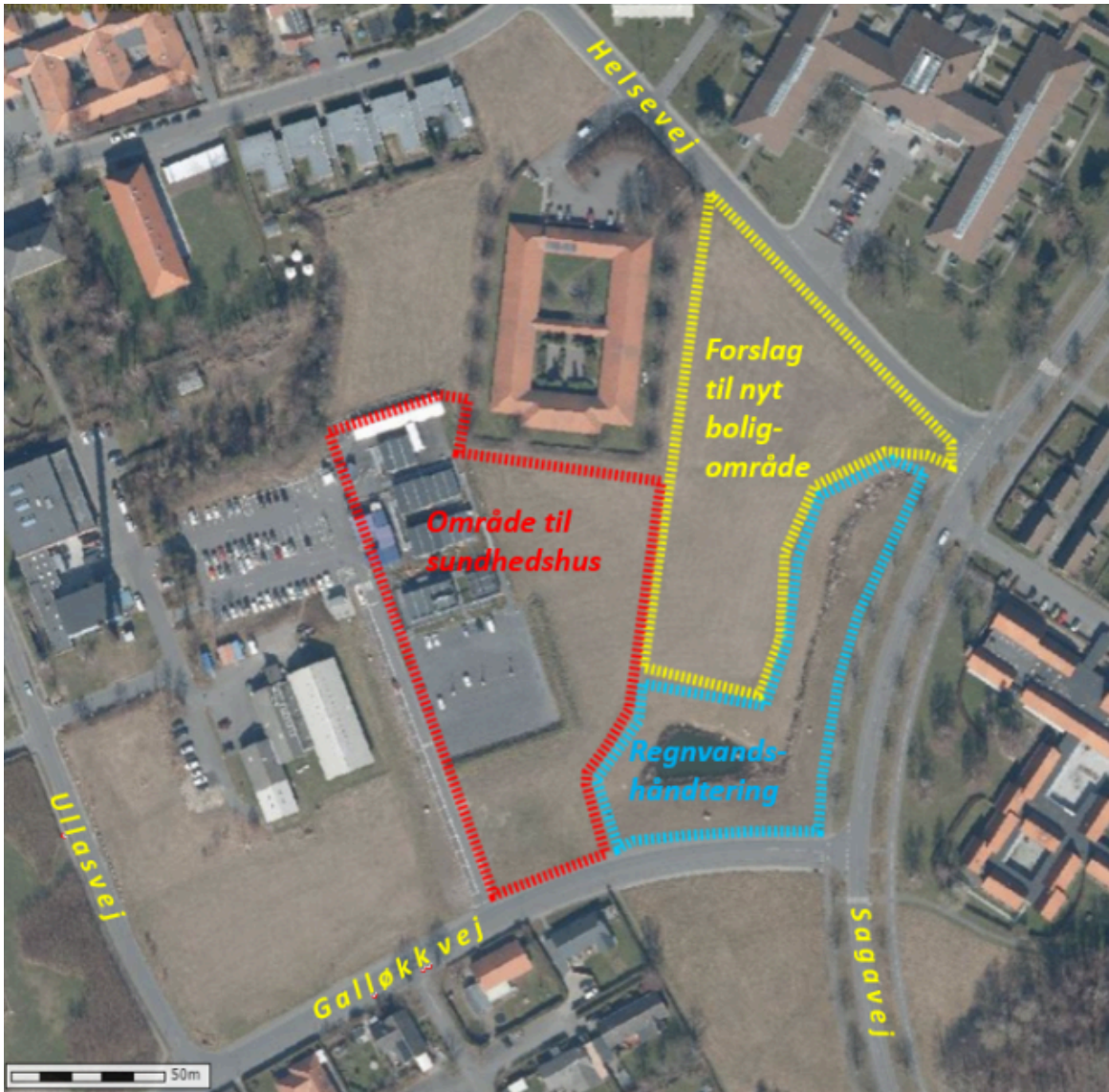
Forslag til disponering af arealerne omkranset af Galløkkevej, Sagavej og Helsevej

Planlægning for et sundhedshus vil være i overensstemmelse med kommuneplanen