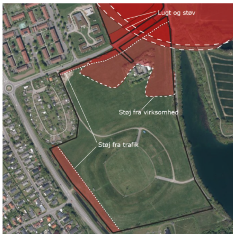
Billedtekst: Kort, der viser udbredelsen af de forskellige miljÅ¥pÅ¥virkninger.

Det sammenfattende kort viser, at grunden nord for TornevÅ¥rksvej er belastet af bÅ¥de stÅ¥, j, stÅ¥, v og lugt fra BOFA. Grunden indgÅ¥r derfor ikke i masterplanen. Det nordÅ¥stlige hjÅ¥rne af det areal, som indgÅ¥r i masterplanen, syd for TornevÅ¥rksvej, er ligeledes belastet af stÅ¥, j, lugt og stÅ¥, v.