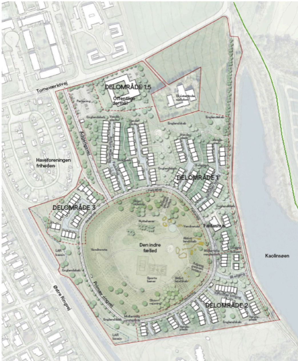
Billedtekst: Planlægning fra masterplanen. Boligbebyggelserne omkranser stadionvoldene. Stien Den Grønne Ring er vist med grøn linje, st for Kaolinsøen.