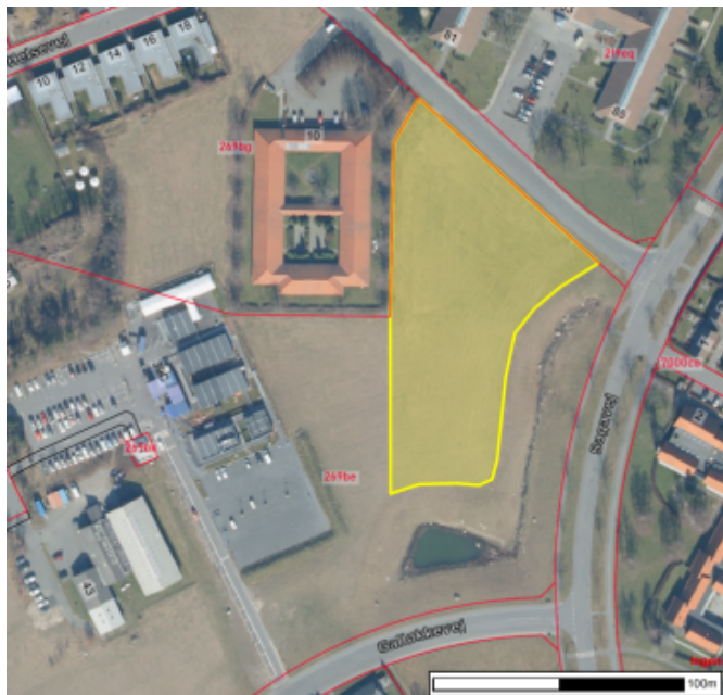
Figur: Arealet, som skal anvendes til boligformål, er markeret med gult på luftfotoet.

Forslaget til kommuneplantillæg udarbejdes parallelt med forslaget til lokalplan.