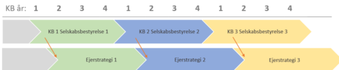
Figur 2: Ny sammenhæng mellem KB og bestyrelsesperioder og ejerstrategier ved forskydning

Forskydelsen, som vist i figuren ovenfor, vil give Kommunalbestyrelsen tid til visions- og strategiarbejde, samt til overveje, hvordan BEOF kan understøtte disse visioner og strategier.