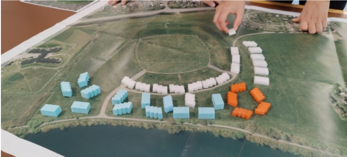
Workshop: 120 boliger i hhv. 1 og 2 etager indplaceres forsøgs-mæssigt omkring stadionanlægget.