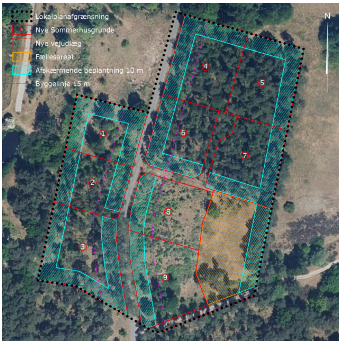
Oversigtskort med planområdets arealdisponering

Under den offentlige høring indkom der 20 høringssvar, som fremgår i deres fulde længde af bilag 4 og i resumeret form af bilag 5. Derudover fremgår administrationens bemærkninger til de enkelte høringssvar også af bilag 5. Grundejers bemærkninger til de indkomne høringssvar fremgår af bilag 6. Flere af høringssvarene er modtaget mere end en gang, men de fremgår kun af opgørelsen og bilagene én gang.