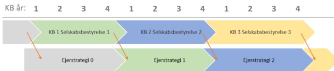
Figur 1: Nuværende sammenhæng mellem kommunalbestyrelser, selskabsbestyrelser samt ejerstrategier

BRKs aktieselskaber har generelt fireårige ejerstrategier, som i udgangspunktet følger kommunalbestyrelsesperioder. Det vil sige, at de gældende ejerstrategier for selskaberne er godkendt af den forrige Kommunalbestyrelse. En ny selskabsbestyrelse arver altså en ejerstrategi, som er udarbejdet i udkast af den tidligere bestyrelse, og godkendt af den tidligere Kommunalbestyrelse. Selskabsbestyrelserne og Kommunalbestyrelsen sætter altså i udgangspunktet først sit aftryk i ejerstrategien for den efterfølgende 4-årige periode. Se figur 1 nedenfor.