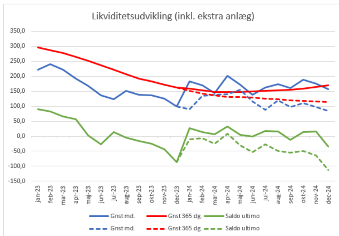
Graf 2: Likviditetsudvikling 2024

Den faktiske udvikling svarer nogenlunde til prognosen fra starten af året, dog på et lidt højere niveau.