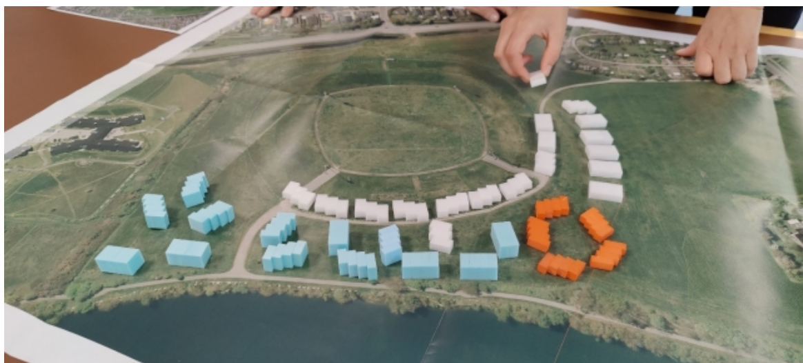
Workshop: 120 boliger i hhv. 1 og 2 etager indplaceres forsøgs-mæssigt omkring stadionanlægget. (Foto: Arkitema)

Primo marts – primo april. Udarbejdelse af endeligt forslag til overordnet masterplan