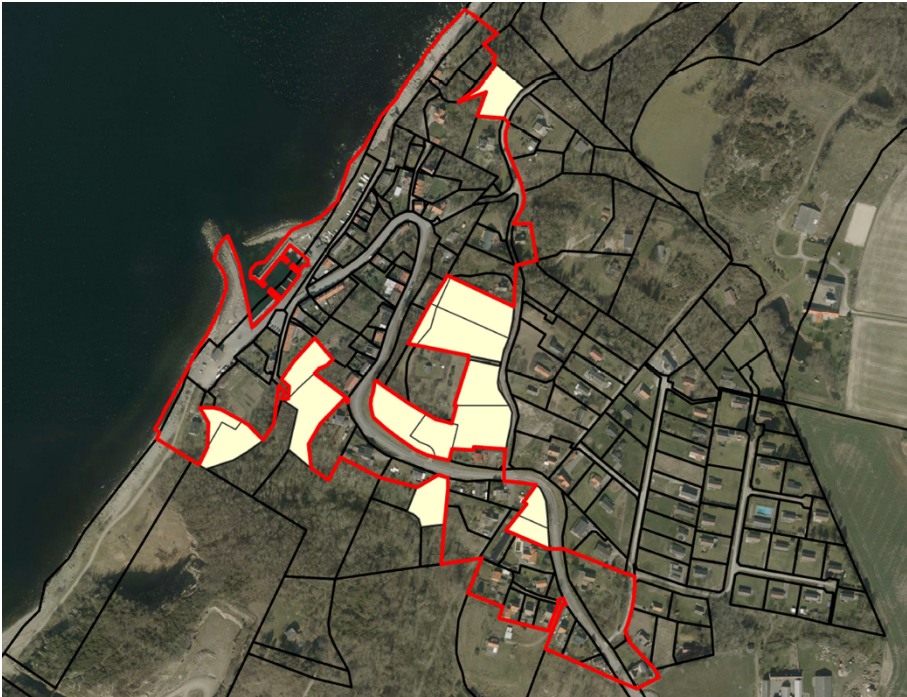
III 1 viser planudvidelsen.

Lokalplanområdet er inddelt i 3 delområder. Delområderne A og B må anvendes til boligformål herunder erhverv, der kan indpasses i beboelsesområdet uden at være til gene for de omkringboende. Delområde A, hvor bevaringsbestemmelserne vil blive administreret restriktivt på baggrund af byggeansøgninger vedrørende alle ydre forhold omfatter den ældste bebyggelse nærmest kysten. Da afgræsningens formål er at bevare bymæssige helheder, indgår enkelte nyere ejendomme også i delområdet. Bygningerne i delområde B, primært beboelseshuse, spænder bredt i både byggeår og -stil. Generelt er der dog fortsat tale om et relativt velbevaret og homogent historisk bymiljø. Delområde H udgøres af Vang Havn og byens havnefront, og området må anvendes til fritidsformål (småbåds- og fritidshavn; klub- og foreningsfaciliteter m.fl. aktiviteter), samt erhverv, der kan indpasses uden at være til gene for de omkringboende.