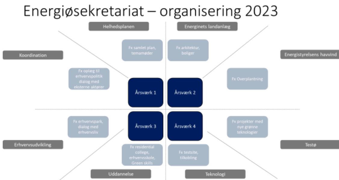
Figur 1: Opgaver i Energiøsekretariatet 2023

Sekretariatet foreslås finansieret frem til og med 2026. I 2026 skal det revurderes, hvilken indsats der er nødvendig, for at Bornholms Regionskommune får tilstrækkelig ud af Energiø Bornholm.