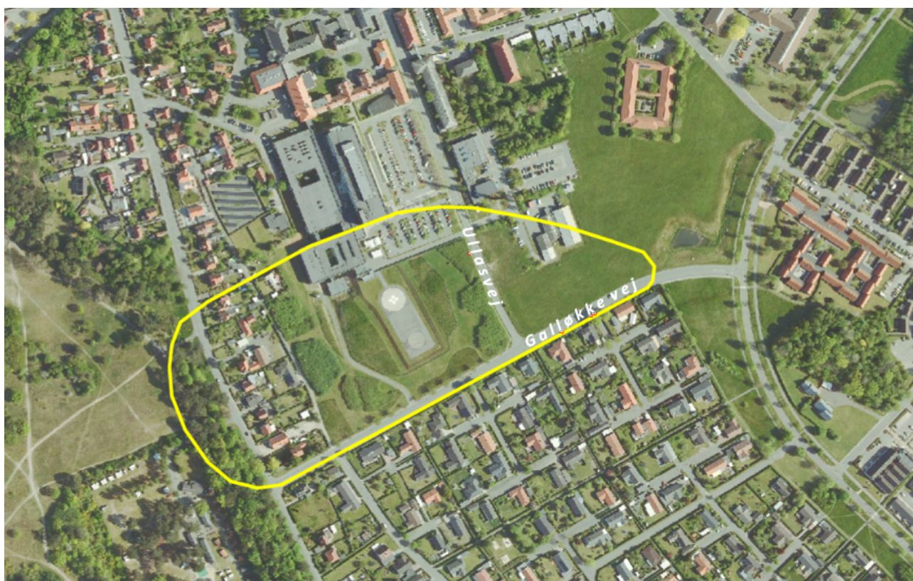
Beliggenheden af 55 dB L_{DEN} -konturen omkring helikopterlandingspladsen ved Bornholms Hospital. Inden for den gule streg er støjbelastningen over denne værdi.

Luftfotografiet nedenfor viser det areal omkring helikopterlandingspladsen, hvor genevirkningen er beregnet til værdien 55 dB L_{DEN} .