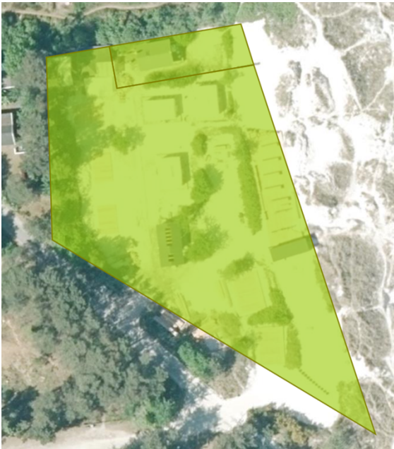
Her kan anses teltene på deres plateauer.

Eco Beach Camp er indrettet med 8 éns bomuldstelte på 24 m 2 , placeret på hver deres fritliggende træplateau. Plateauerne kan fjernes efter sæsonen slutter. Syv af teltene bruges til beboelse. Der findes en toiletbygning på arealet samt en mobil køkken/café, beklædt i douglasfir, også på træplateau, umiddelbart bag klitten.