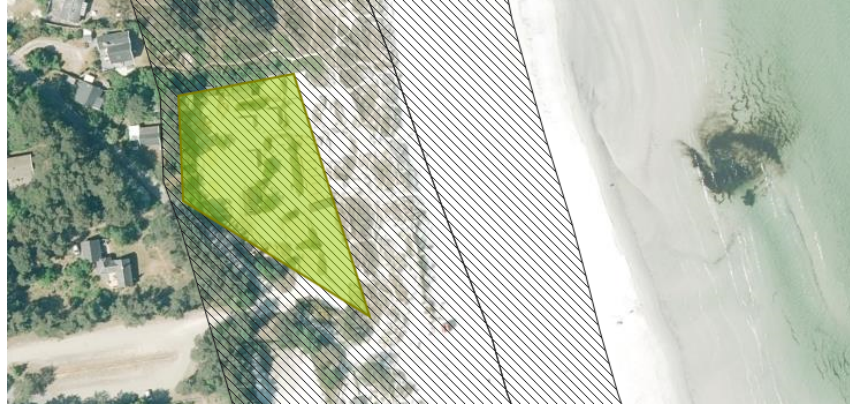
Eco Beach Camp ligger i Balka. Strandbyggelinien er markeret med skravering.

Eco Beach Camp er indrettet med 8 éns bomuldstelte på 24 m 2 , placeret på hver deres fritliggende træplateau. Plateauerne kan fjernes efter sæsonen slutter. Syv af teltene bruges til beboelse. Der findes en toiletbygning på arealet samt en mobil køkken/café, beklædt i douglasfir, også på træplateau, umiddelbart bag klitten.