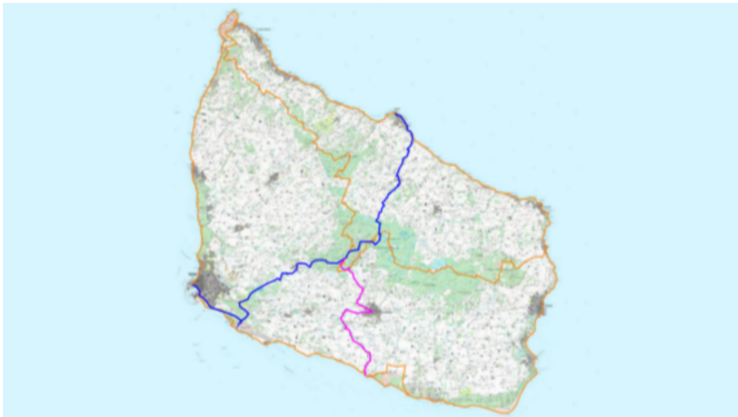
Illustration: Illustrationen viser i hovedtræk forløbet af de to ønskede stiforbindelser indtegnet med blå og pink. De præcise forløb fastlægges i løbet af projektperioden. Langdistanceruterne Kyststien og Højlyngsstien er indtegnet med orange.