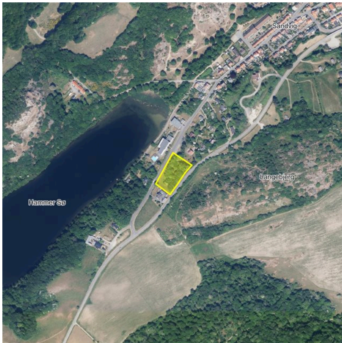
Oversigtskort med indtegnede planområde

Kommunalbestyrelsen besluttede den 10. oktober 2024, at administrationen skulle udarbejde forslag til et kommuneplantillæg samt en lokalplan.