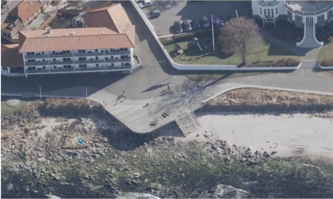
På luftfotoet ses

terrassen ved Strandpromenaden i Sandvig.