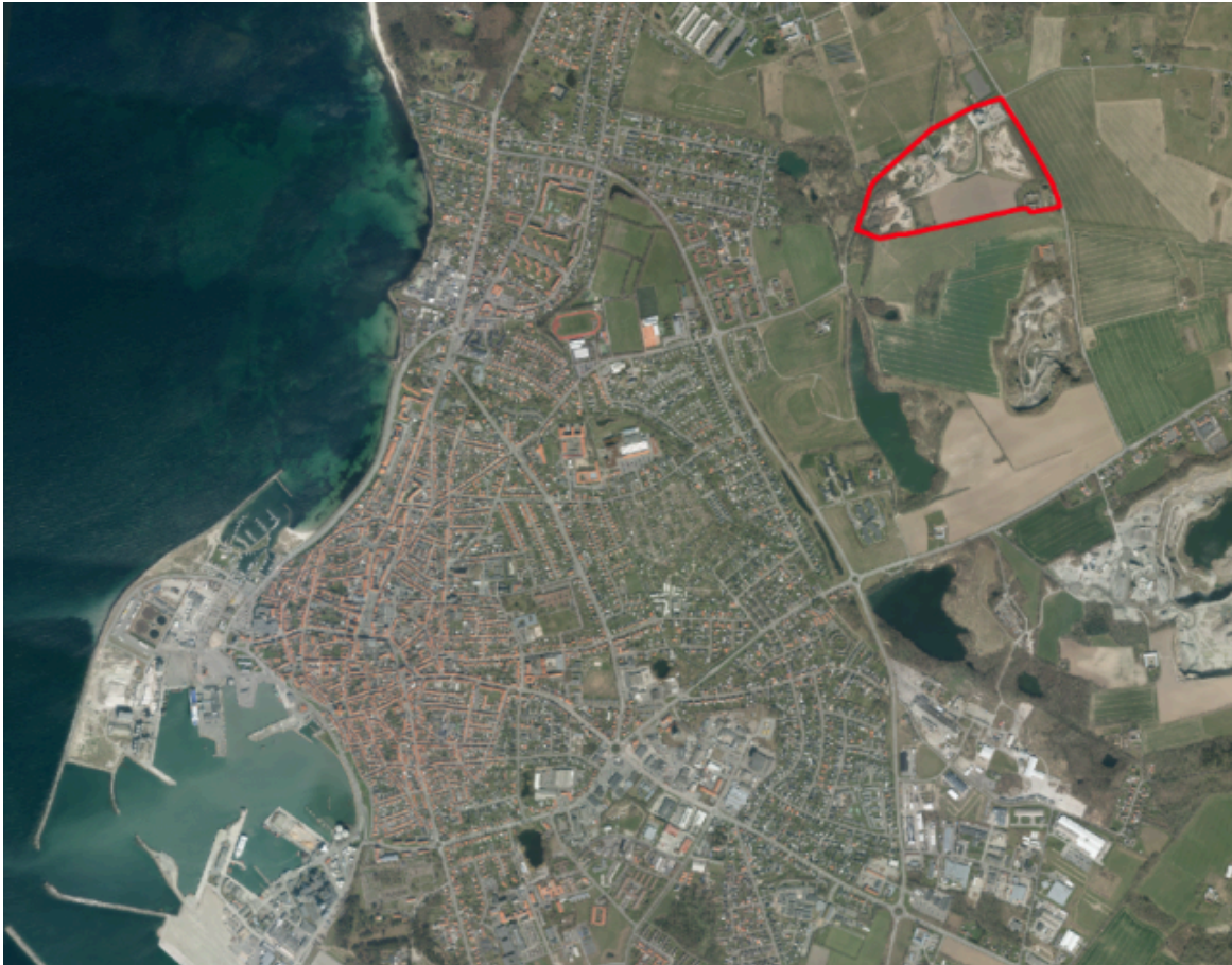
Figur 1 - Planområdet ligger tæt på Rønne by

Administrationen vil foreslå, at den kommende planlægning kommer til at sikre, at BOFA får planlægningsmæssige rammer, der kan sikre en langsigtet og helhedsorienteret løsning for BOFA's samlede areal til affaldsbehandling. Dette kan ske ved at inddеле det samlede område i delområder alt efter graden af miljøpåvirkning på omgivelserne. Fremtidige aktiviteter, der kun påvirker omgivelserne i mindre grad, bør placeres mod vest, hvor der er den korteste afstand til Rønne by. Mens aktiviteter, der er mere belastende for omgivelserne bør placeres længere mod øst, hvor der er åbent land. Herved vil kommuneplanens miljøkonsekvenszone omkring BOFA kunne blive justeret, så den ligger væk fra byen, (i stedet for ind mod byen, som i dag), så konflikter mellem nuværende og fremtidige byfunktioner i Rønne og BOFA's behov for fremtidige nye anlæg til affaldshåndtering kan løses hensigtsmæssigt.