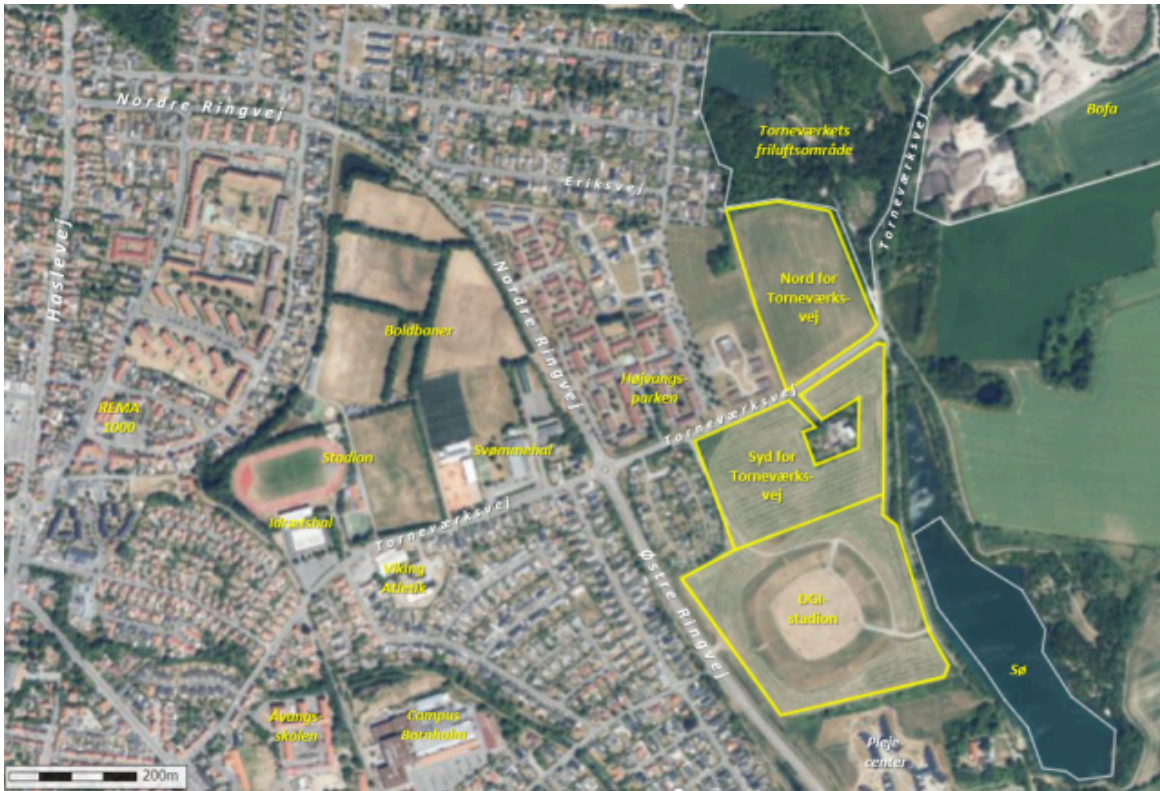
På luftfotoet er de

tre arealer vist i sammenhæng med omgivelserne.