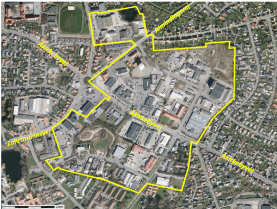
Illustrationen viser udstrækningen det aflastningsområde til store butikker, som blev vedtaget af Kommunalbestyrelsen i december 2023

Aflastningsområdet (ved Almindings Runddel) er et større område, som er udlagt til brug for nye store butikker med henblik på at tjene flere formål: