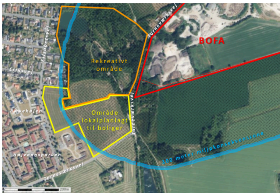
Figur 2. Kommuneplanens eksisterende miljøkonsekvenszone på 300 meter er i konflikt med en eksisterende lokalplan fra 1983, der udlægger et areal mellem Kommandanthøjen og Torneværksvej til boliger. Der er endvidere overlap mellem miljøkonsekvenszonen og det rekreative område mellem Elisabetsvej og BOFA.

Den eksisterende miljøkonsekvenszone overlapper eksisterende miljøfølsomme anvendelser