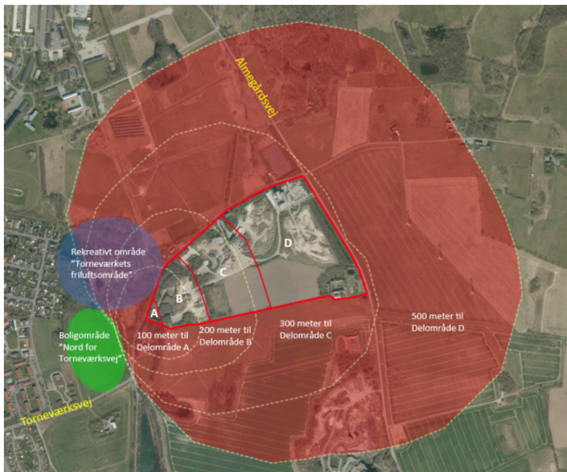
Figur 4 Forslag til inddeling af BOFA's samlede areal i følgende delområder A, B, C og D. Delområderne har til formål at en fremtidig miljøkonsekvenszone kan se ud som på kortet. Miljøkonsekvenszonen vil dog først blive ændret i takt med at den faktiske anvendelse ændrer sig.: