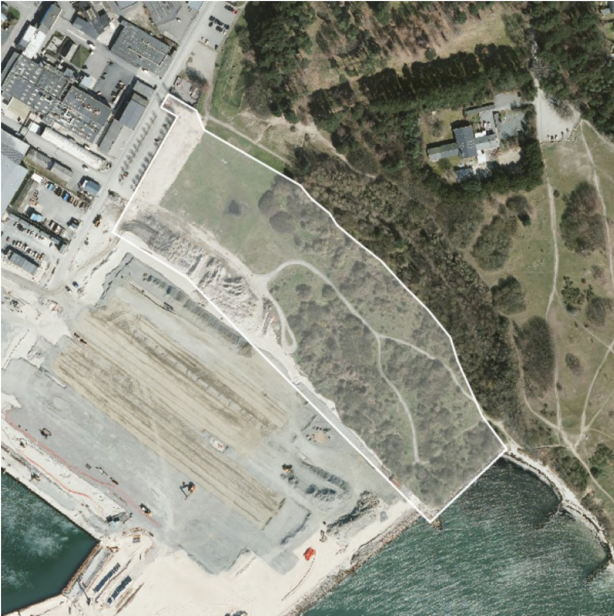
Luftfoto af de eksisterende forhold i planområdet. Fotografiet er taget før den ny strand blev etableret.