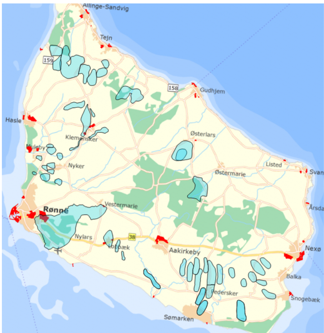
Vandindvindingsområder (blå) og kommuneplanlagte erhvervsområder (rød)

hensigtsmæssig placering af erhvervsaktiviteter. Undersøgelsen ventes afsluttet i efteråret 2018.