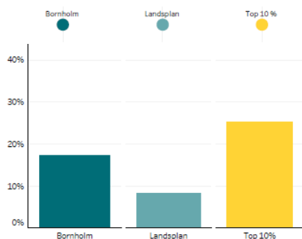
Andel borgere i job eller uddannelse

Dertil kommer den viden og erfaring som jobcentret og den enkelte sagsbehandler får igennem projektet. Vi får en klar føling med hvilken type indsats der virker for netop denne målgruppe, en viden vi kan og vil bruge til at brede de positive erfaringer ud på andre målgrupper.