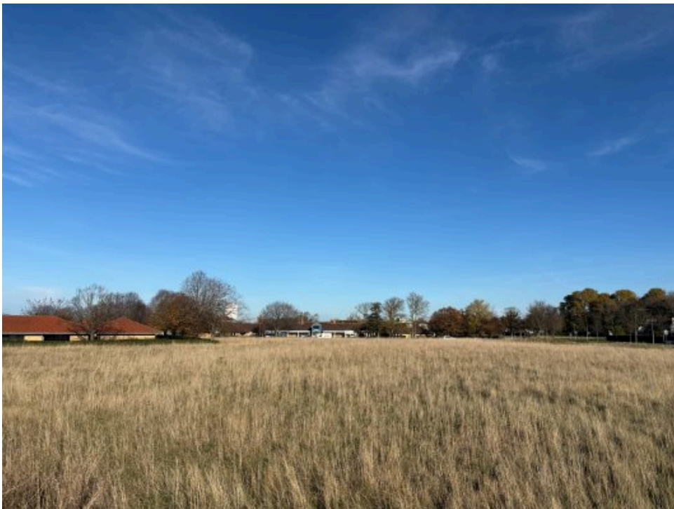
Området, som i dag er græsbevokset, er nabo til plejehjem og hospitalet