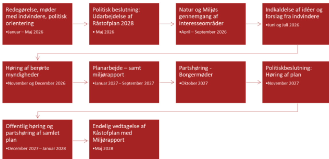
Figur 1 – procesplan for råstofplan 2028