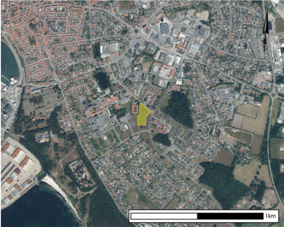
Projektområdet i Rønne Syd, med 700 meter til stranden.