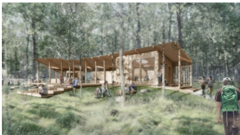
Visualisering af trailcenteret.

Trailcenteret er udformet under hensyntagen til den eksisterende skovbeplantning. Bygningen er formet rundt om skovebeplantningen, så flest mulige træer bevares. Bygningens dæk udføres på pæle, så skovbunden forstyrres mindst muligt. Bygningen strækker sig ud mellem skovens træer og leder sine brugere videre ud i naturen. Trailcenteret består af ca. 150 m 2 bebygget areal, som udgøres af dæk, ramper, trapper og træbelagt sti. Ud af det samlede bebyggede areal vil ca. 100 m 2 være overdækket, og heraf vil ca. 19 m 2 være lukkede rum. Trailcenteret er udformet med ensidig taghældning og vil have en bygningshøjde på ca. 4 meter målt fra overkant af dæk til overkant af tag.