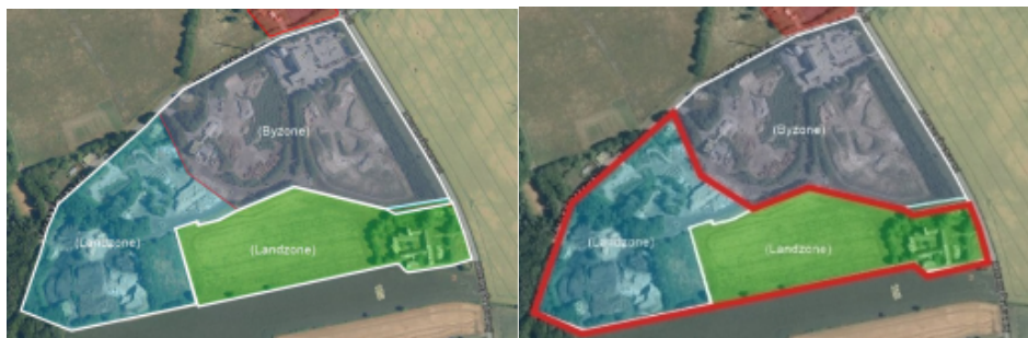
Figur 3, Til venstre: eksisterende forhold. Til højre: fremtidige forhold, rød streg = ny byzone

Med en lokalplan vil områdets zonestatus kunne ændres fra landzone til byzone, så hele BOFA's område herefter vil ligge i byzone. Dette vil sikre en nemmere sagsbehandling i forbindelse med områdets fremtidige udvikling.