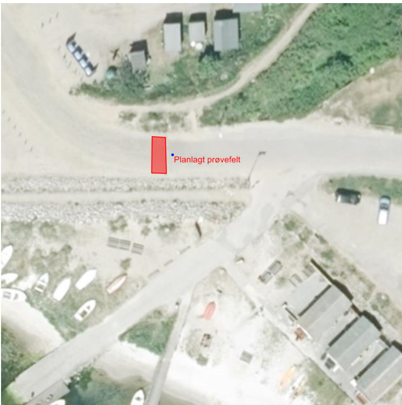
Figur 2 Planlagt prøvefelt