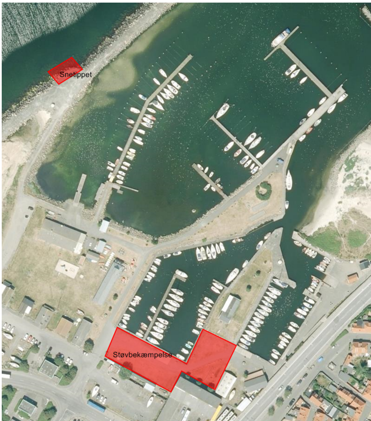
Figur 1 Kort over Snetippets placering samt areal for støvbekæmpelse

Brugerne har også efterspurgt en løsning på at fjerne støvgener på arealet syd for mellembassinnet. Denne bevillingsansøgning omfatter også en ændring af dette færdselsareal fra grus-belægning til græsarmering.