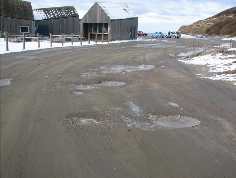
Figur 1 Vejen til Hammerhavnen februar 2018

Ombygningen af Hammerhavnen er blevet en endnu større succes end forventet. De mange brugere og besøgende betyder stor slidtage på den vej, der betjener havnen. Vejen er nedlagt som offentlig vej og bør forbedres, så den får samme standard som resten af havnen.