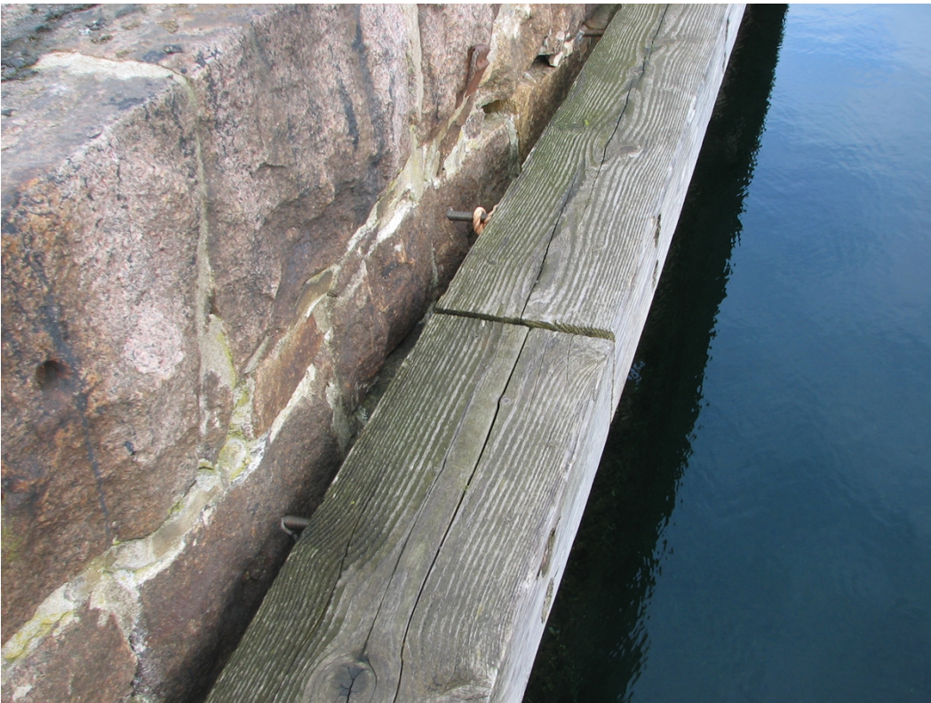
Figur 2 Ny type vaterliste