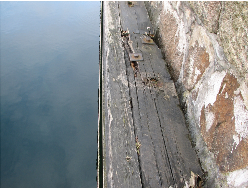
Figur 1 Traditionel dobbelt vaterliste