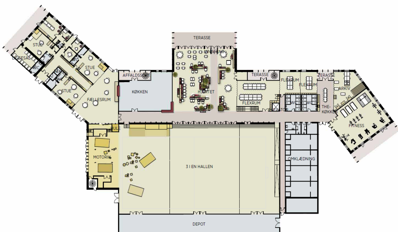
STUEN PLAN 1

Administrationen anbefaler flytningen, som vil give adgang til nye lokaler med god tilgængelighed i en social sammenhæng, der skaber gode muligheder for at opbygge fællesskab på tværs af brugergrupper og generationer.