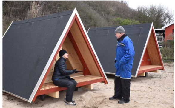
Nye shelters ved Boderne