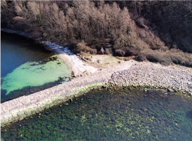
Shelter ved Hammerhavn