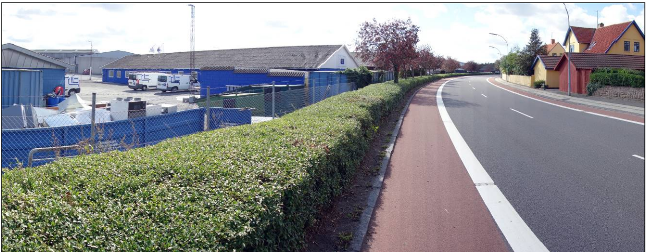
Området til venstre i billedet (mellem havnebassinerne og Søndre Landevej) foreslår REMA 1000 bliver udlagt som bymidte.

REMA 1000 har ladet udarbejde notatet "Udvidelse af Nexø bymidte" dateret 08.03.2019. Der argumenteres i notatet med, at Nexø bymidte både kan udvides i nordlig retning ud mod Nexø Mole og i sydlig retning langs havnebassinerne og Søndre Landevej ud til Søbækken. Det beskrives, at der netop vil være tale om en udvidelse af bymidten indefra og ud og mod områder, der har en vis koncentration af bymidtefunktioner. Det nævnes endvidere, at ved at inddrage områderne både mod nord til Nexø Mole og mod syd ud til Søbækken som en del af Nexø bymidte vil der blive skabt mulighed for at etablere flere publikumsorienterede funktioner.