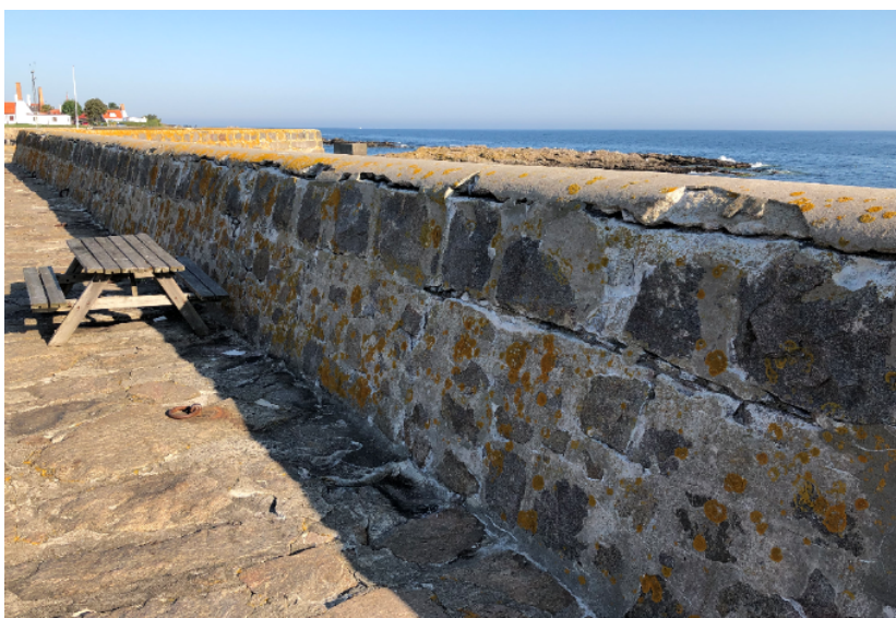
Billede 1: Strækning med behov for sikring via regulært fugearbejde.

Efterfølgende har man i Center for Natur, Miljø og Fritid indhentet nye faglige vurderinger af havneværkernes tilstand og det planlagte sikringsarbejde. Anbefalingerne peger på et behov for akut sikring af kajstrækninger og mure på hele havnens areal i form af regulært fugearbejde med udbedring af forvitrede fuger og revner i både kajanlæg og bølgeskærm. Dette arbejde vil sikre mod yderligere nedbrud i form af frostsprængninger og skader ved stærk pålandsvind. Ydermere mindskes indtrykket af manglende vedligehold og forfald som præger denne del af havnen i dag. Anbefalingerne ligger i tråd med ønsker fra brugerrådet.